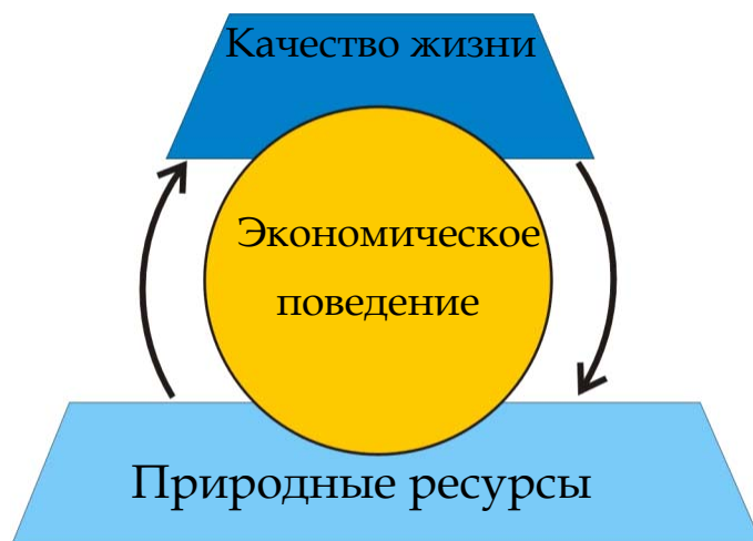
Рисунок 4.1: Взаимодействие между экономикой, окружающей средой и обществом

Олборгская хартия (Хартия Европейских городов по устойчивому развитию), подписанная более чем 700 местными правительствами Европы, ставит под вопрос представление о том, что экономика считается «вещью в себе». Альтернативная идея предлагает иерархический порядок расстановки этих трех элементов: «Мы стремимся к достижению социальной справедливости, устойчивой экономики и устойчивости в окружающей среде. Социальная справедливость обязательно должна быть основываться на экономической устойчивости и справедливости, что требует экологической устойчивости». 2